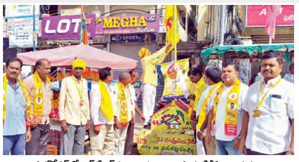
ఘట్కేసర్లో ఎన్టీఆర్ కు నివాళులు అర్పిస్తున్న డిడిపి నాయకులు