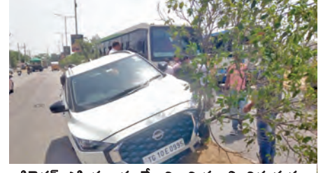
డివైడర్ ఎక్సెస్ కారు వేగాన్ని నియంత్రించిన వృక్షం