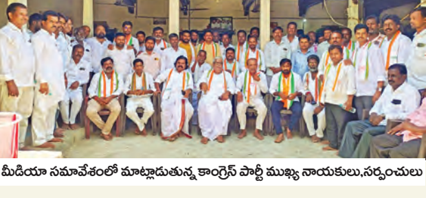
మీడియా సమావేశంలో మాట్లాడుతున్న కాంగ్రెస్ పార్టీ ముఖ్య నాయకులు, సర్పంచులు