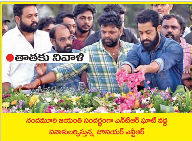
నందమూరి బియ్యం సంస్థానం ఎన్టీఆర్ ఫూల్ వద్ద నివాళులర్పిస్తున్న జానీయర్ ఎస్ఐఆర్