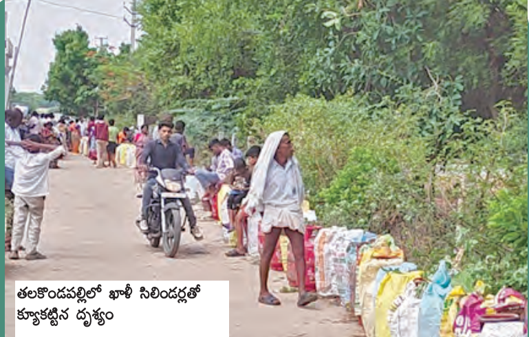
తలకొండపల్లిలో ఖాళీ సిలిండర్లతో క్యూకట్టిన దృశ్యం