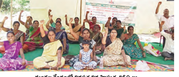
మండల కేంద్రంలో నిరసన నిర్వహిస్తున్న జేపీసీ లు.